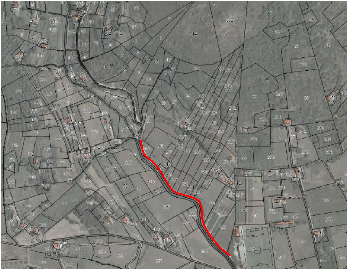
STRADA COMUNALE DEL BOTRO