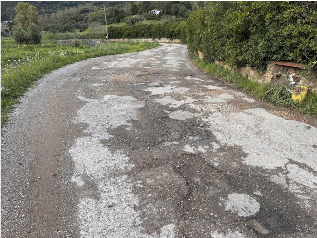
STRADA COMUNALE DEL BOTRO