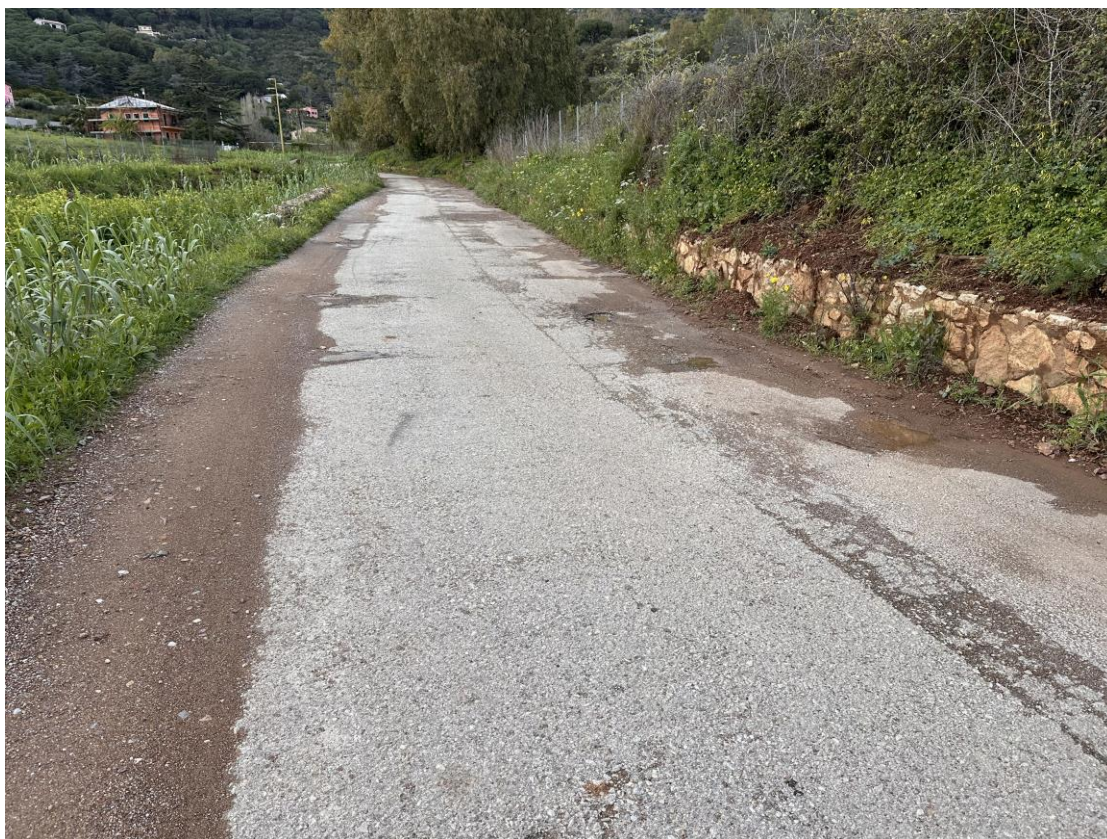
STRADA COMUNALE DEL BOTRO