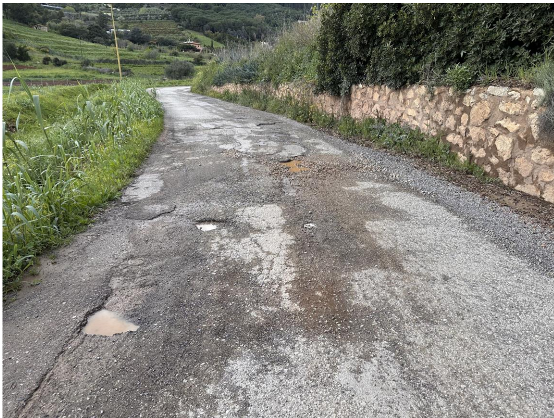
STRADA COMUNALE DEL BOTRO

Ufficio Tecnico - Lavori Pubblici e Tutela del Territorio