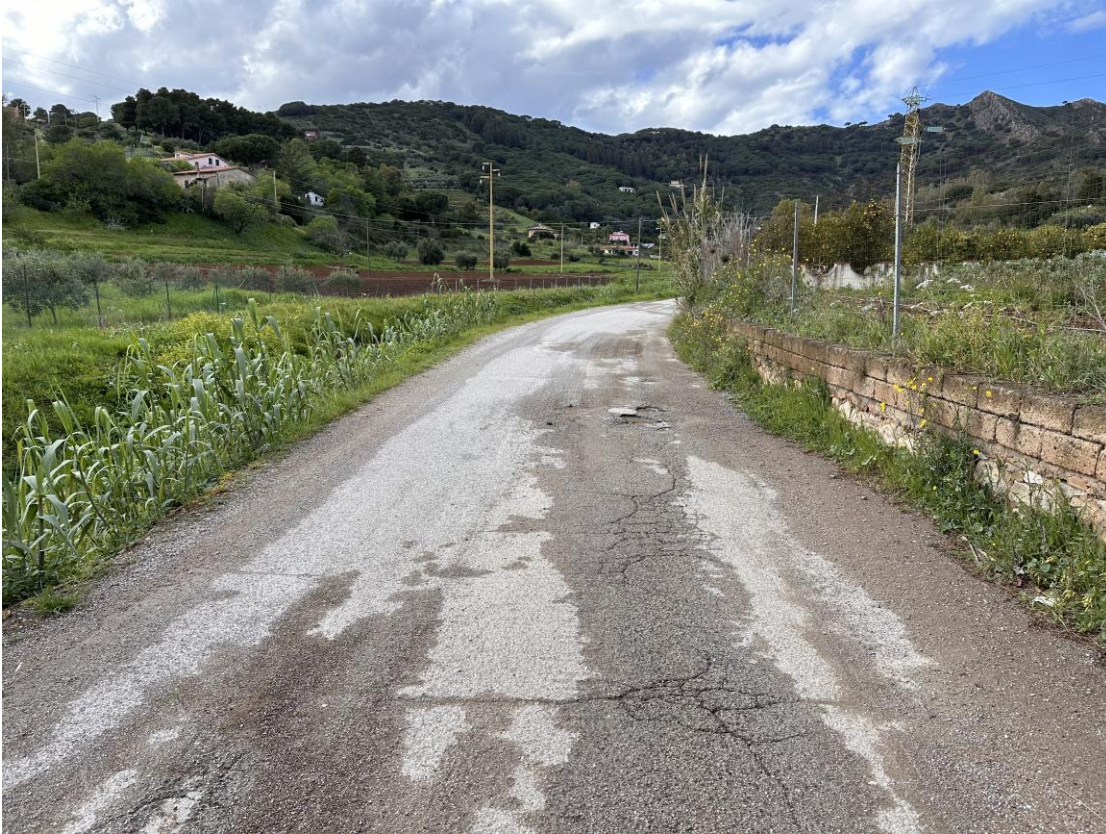
STRADA COMUNALE DEL BOTRO