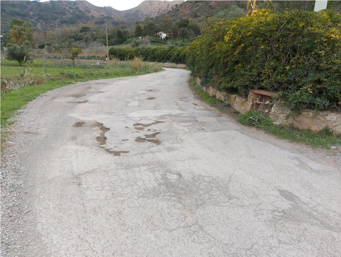
STRADA DEL BOTRO

Ufficio Tecnico - Lavori Pubblici e Tutela del Territorio