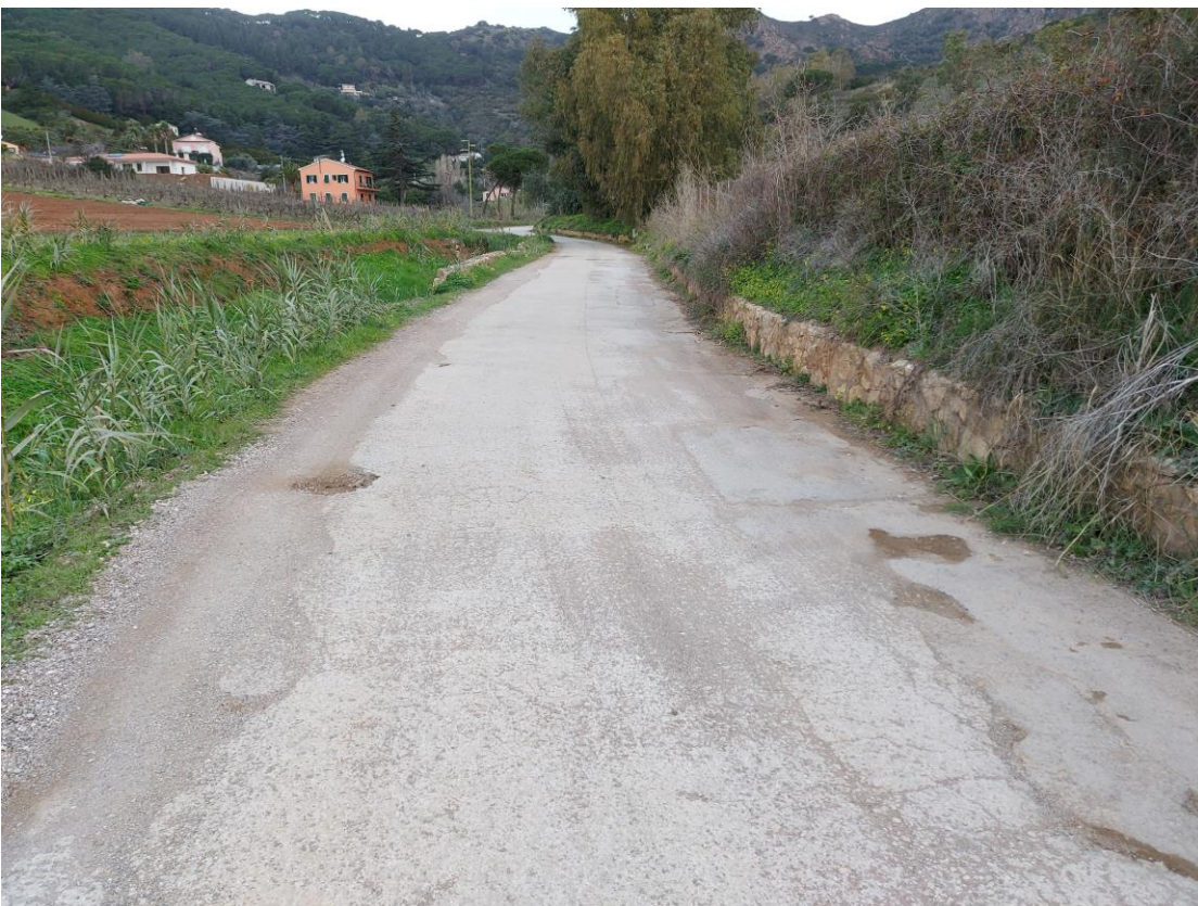
STRADA DEL BOTRO