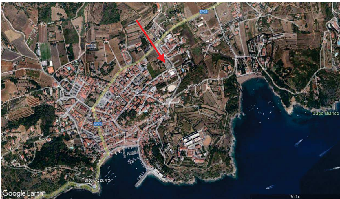
Immagine da satellite con il centro di Porto Azzurro e indicato con la freccia rossa l'ubicazione dell'intervento in località Bocchetto

L'area su cui è previsto l'intervento fa parte di una più ampia area occupata da servizi di interesse generale (magazzino comunale), ubicata in loc. Bocchetto, accessibile dalla strada provinciale n.26 tramite la via comunale e successivamente dal cancello di accesso al magazzino comunale.