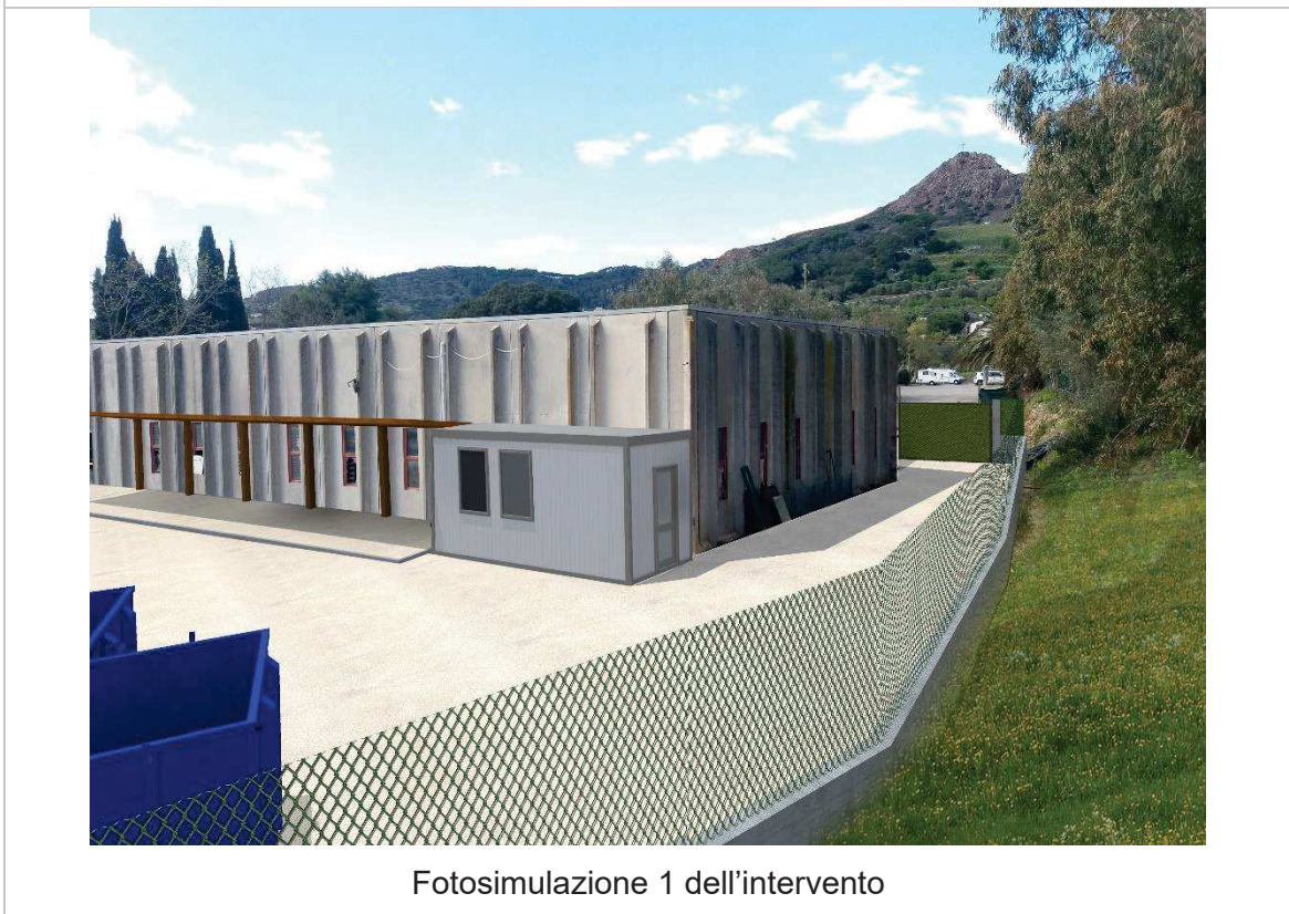
Fotosimulazione 1 dell'intervento