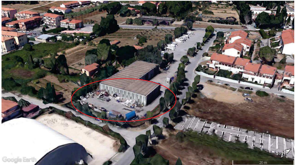
Estratto immagine aerea.

Si rimanda alla Tavola D01 (Documento n.07) per una migliore comprensione planimetrica della situazione attuale.