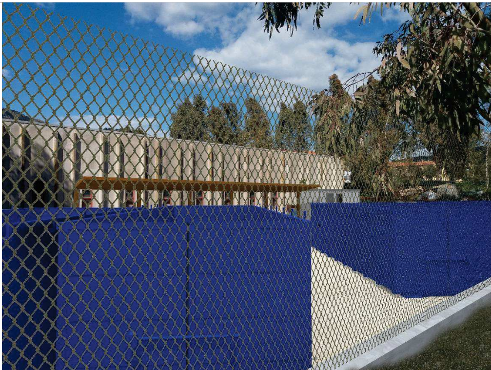
Fotosimulazione 2 dell'intervento